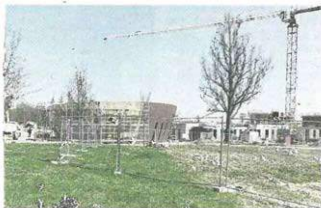
■ Cette architecture moderne fait écho au centre aquatique et à la salle Jean-Carmet.

La participation du conseil général s'élève à 316 700 €.