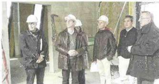
■ Visite de chantier pour les élus, ce mardi matin.